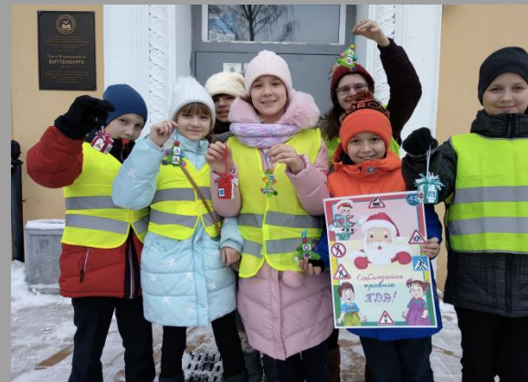
Акция «Безопасный Новый год»