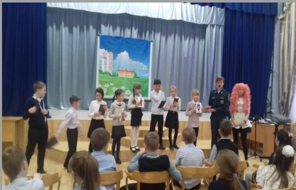
«Школа безопасности». Интерактивное мероприятие по ПДД для 3-4 классов.