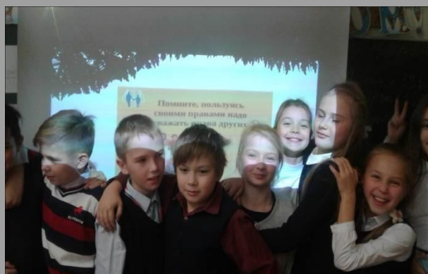
Единый урок по правовой грамотности.